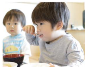
食育・配膳・マナー・栽培 収穫・調理保育