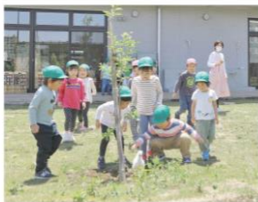
戸外活動・散歩・探検・木工