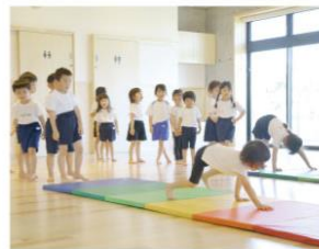
モンテッソーリ活動・体操 音楽・アート・わらべうた