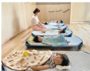
心地良い環境・清潔・生活リズム 安全・睡眠・排泄・衣類の着脱